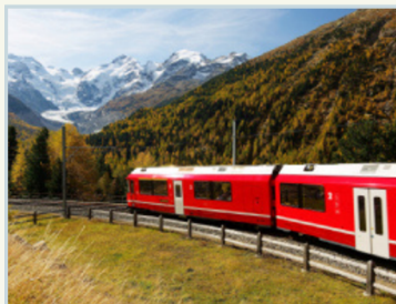
Zürich · Milaan · Chambéry · 15 dagen