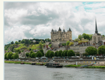
Loire · 8 dagen

Bekijk deze reis op www.ontracktravel.eu