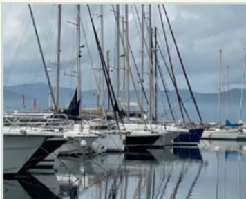
Côte d'Azur · 14 dagen

Van de lavendelvelden van de Provence tot de besneeuwde toppen van de Zwitserse Alpen. Van de pintxos-bars van San Sebastián tot de kastelenroute langs de Loire. OnTrack Travel brengt je naar plaatsen die je bijblijven.